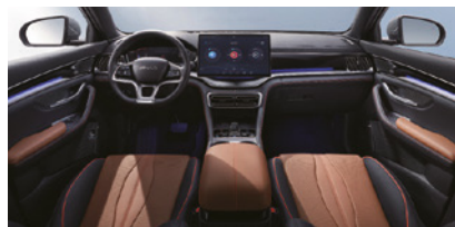
Negro y marrón